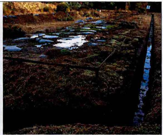
Fotografía 5: Sistema de canalización de aguas lluvias de zanjas al inicio del predio.