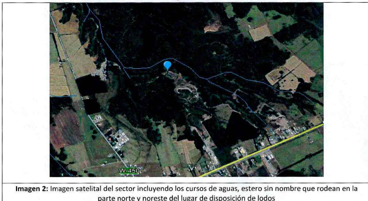
Imagen N° 18

30. Finalmente, el monorelleno de disposición de residuos, se encuentra adyacente a una quebrada, la cual a su vez presenta inestabilidad en el terreno, constatado por una serie de derrumbes en el sector norte y noreste, los cuales han llegado al estero sin nombre, que rodea en gran parte este lugar de disposición final de residuos, tal como se ha verificado en las imágenes 9 a 12 de la presente resolución.