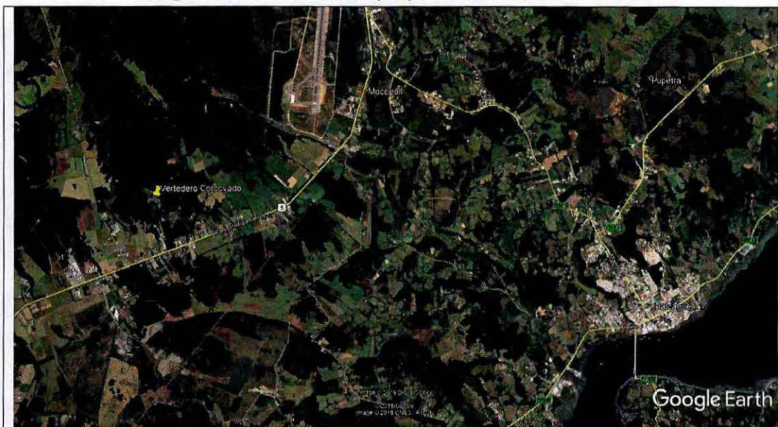
Imagen N° 1. Ubicación del proyecto Vertedero Corcovado.

Ubicación del vertedero Corcovado, Región de Los Lagos, provincia de Chiloé, comuna de Dalcahue, Sector Mocopulli.