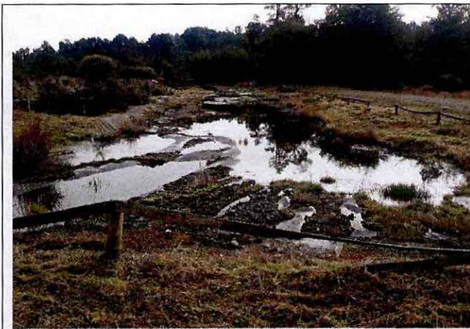
Fotografía 4: Zanjas de mayor data, con líquido en su superficie (identificada como zanja N° 13).