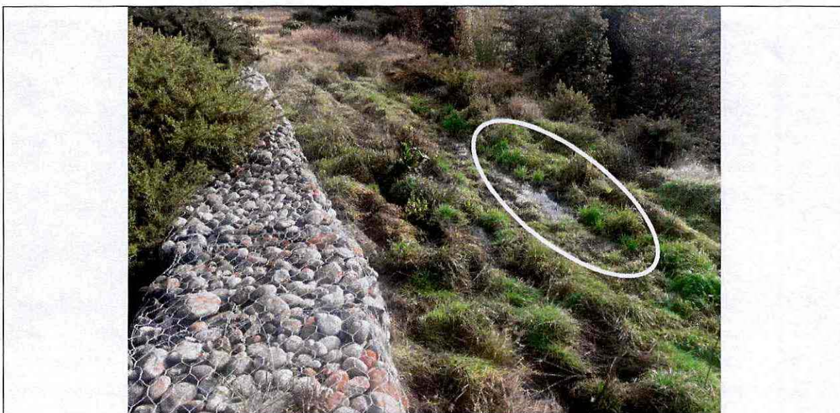
Fotografía 12: En círculo blanco, el sector del camino con apozamiento de líquidos, la distancia aproximada entre el sistema de contención y quebrada es de 5 metros.