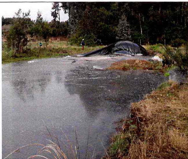
Fotografía 7: Zanja en mal estado con acumulación de biogás.