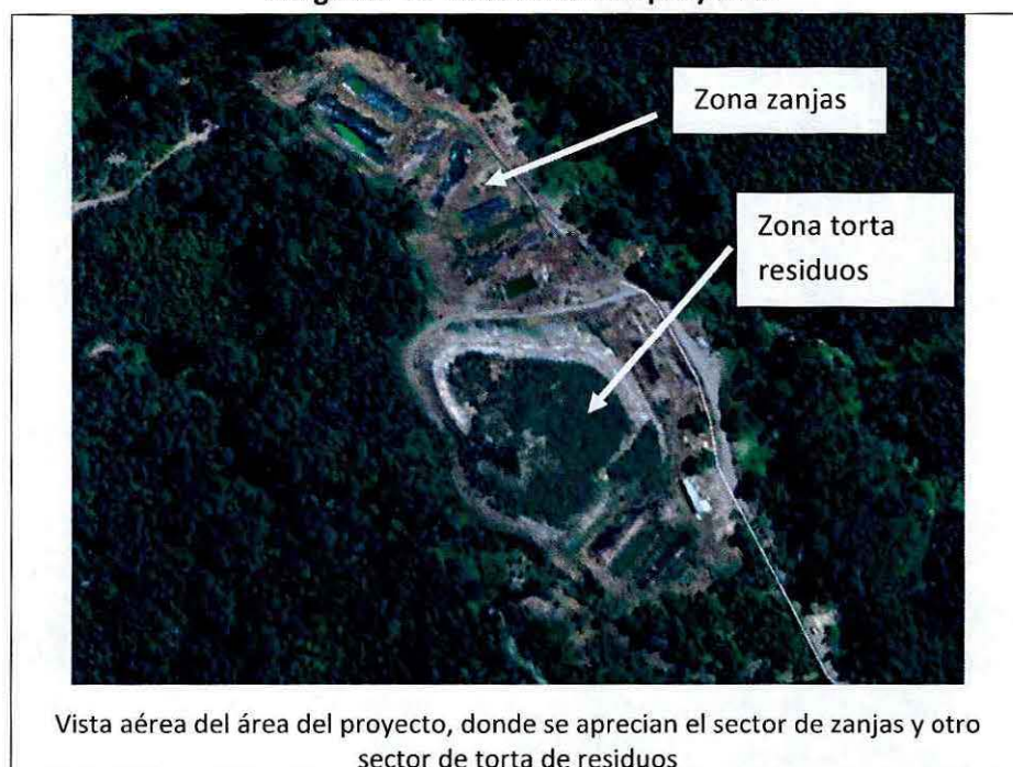
Imagen N° 2. Vista aérea del proyecto.