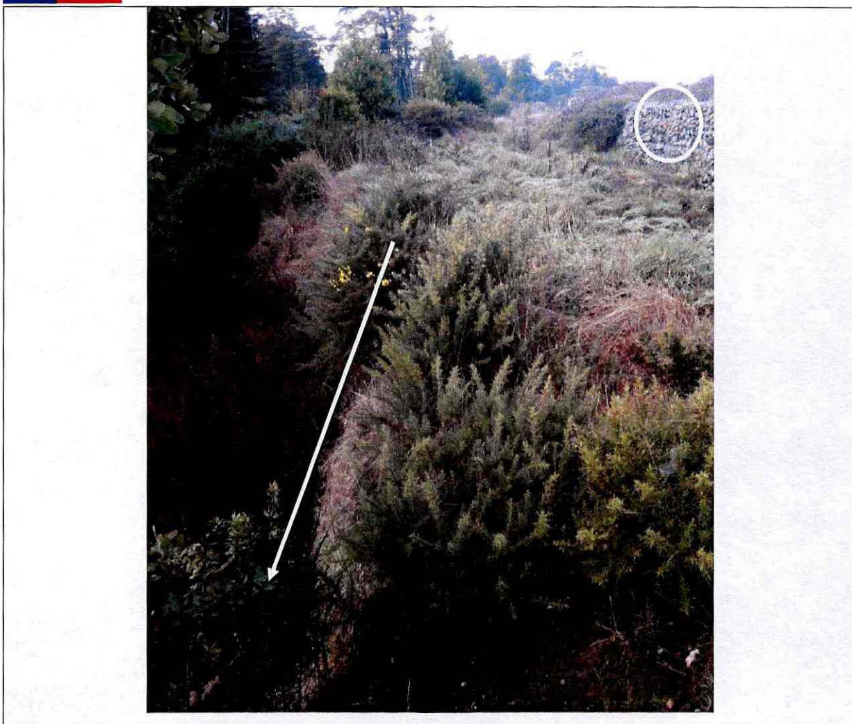
Fotografía 3: Características del terreno en el sector de quebrada, donde se aprecia una pendiente escarpada. Al costado derecho se ven los gaviones que delimitan y contienen la zona de zanjas con la quebrada.